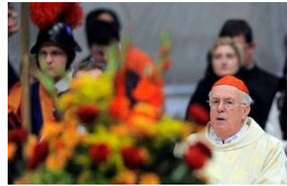
Cardenal Godfried Maria Jules Danneels